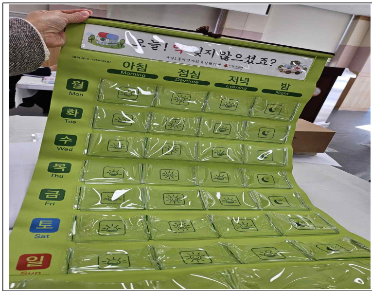
사당1동 어르신 약 달력 표본